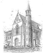
Parochie O.L.V. Onbevleekt Ontvangen Zenderen