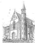
Parochie O.L.V. Onbevleekt Ontvangen Zenderen

Door de toekomstige fusie van onze parochie met de HH. Jacobus en Johannes parochie zal de voorbereiding op en toediening van het Heilig Vormsel het komende jaar niet meer in Zenderen plaatsvinden, maar samen met de vormelingen van Borne en Hertme. Vandaar dat we de oproep tot opgave uit de Kerkwijzer van HH. Jacobus en Johannes hierbij willen melden.